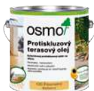
Protišmykový terasový olej