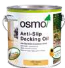
Protišmykový terasový olej