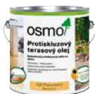
Protišmykový terasový olej