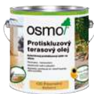
Protišmykový terasový olej