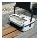
Stroj k čisteniu terás a podláh