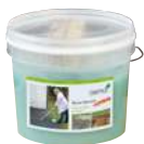
Odšedovač dreva gél

* Používať bezpečne z hľadiska biocídov. Pred použitím vždy prečítať označenie a informáciu o výrobku.